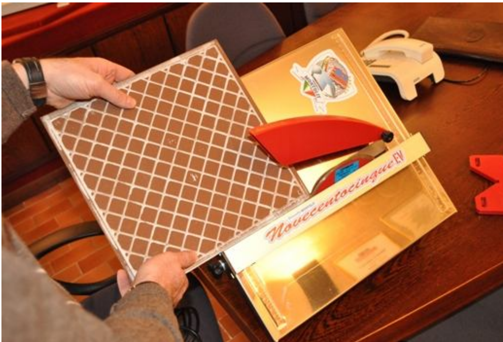
EXECUTIE DE JOLLY FIG.5