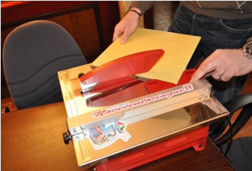
TAIERE 45 GRADE IN PLAN FIG.4