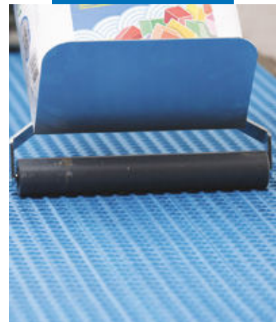
Presarea Mapeguard UM 35