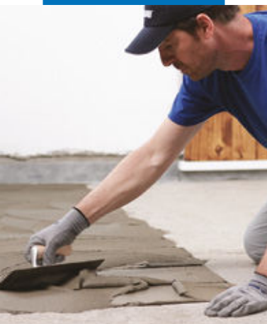
Aplicarea adezivului cu o spatula dintata nr. 5