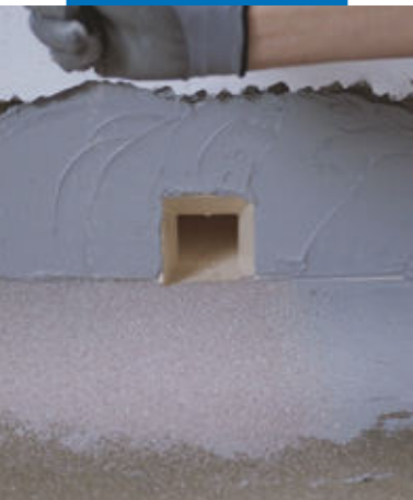
Hidroizolarea scurgerilor cu Drain Front