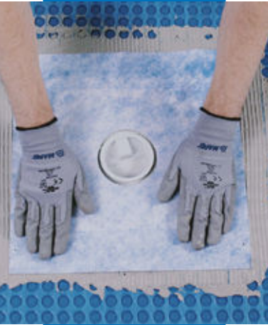
Hidroizolarea scurgerilor cu Drain Vertical/Drain Lateral

Toate referințele relevante despre acest produs sunt disponibile la cerere sau pe www.mapei.com