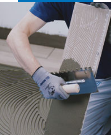
Instalarea ceramicii sau pietrei naturale cu un adeziv Mapei cel puțin clasa C2