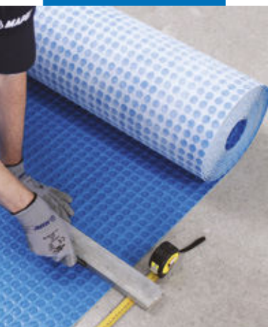
Tăierea Mapeguard UM 35