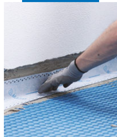
Hidroizolare perimetrală cu Mapeband Easy , lipită cu adeziv Mapeguard WP Adhesive