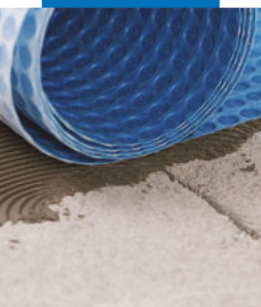
Instalarea Mapeguard UM 35