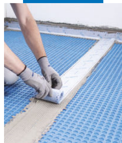
Hidroizolarea roșturilor dintre fâșii cu Mapeband Easy , lipită cu adeziv Mapeguard WP Adhesive