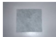
PRIMUS BANDĂ ETANȘARE ARMARE (BHF82) 400 x 400