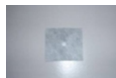
PRIMUS BANDĂ ETANȘARE ARMARE (BHF82) 120 x 120

Super-elastice Impermeabile Ușor de aplicat/montat Rezistente în mediu alcalin