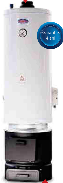
Cazan 2 surse 2 circuite 90l