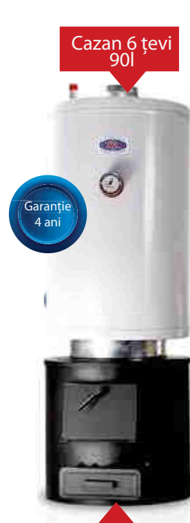
Cazan 6 țevi 90l