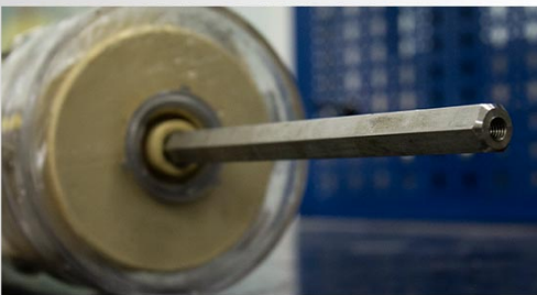
Ax pompa din inox