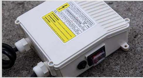
Panou comanda pompa