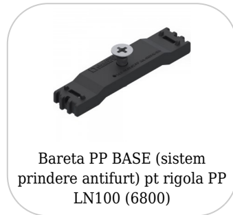
Bareta PP BASE (sistem prindere antifurt) pt rigola PP LN100 (6800)