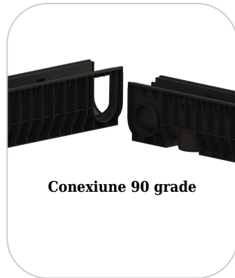
Conexiune 90 grade