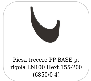
Piesa trecere PP BASE pt rigola LN100 Hex.155-200 (6850/0-4)