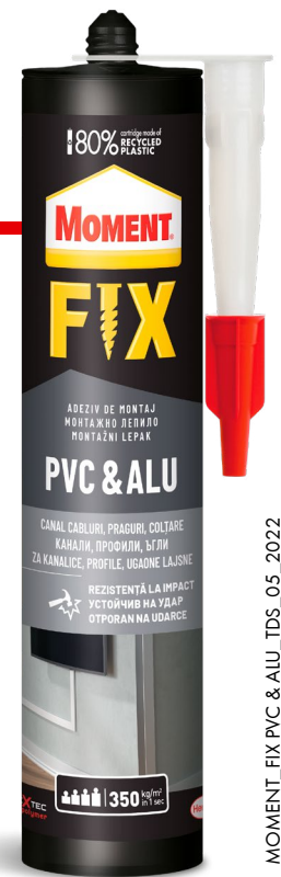
MOMENT_FIX PVC & ALU_TDS_05_2022