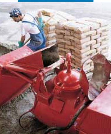
Realizarea amestecului Topcem cu o pompă automată cu presiune