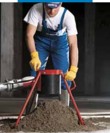
Alimentarea cu amestec Topcem