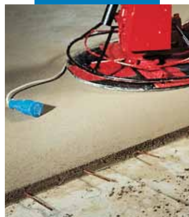
Finisarea suprafeței șapei Topcem cu un elicopter