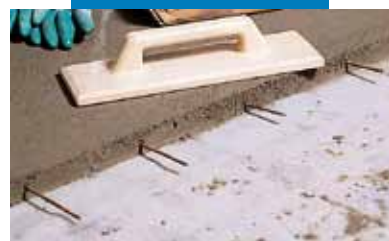
Detaliu șapă cu Topcem