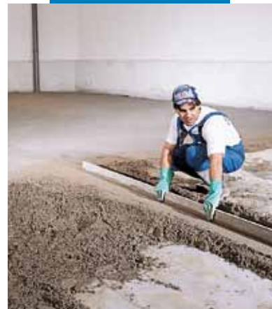
Realizarea fâșiilor de ghidaj și nivel

Rezistență la temperatură: de la -30°C la +90°C