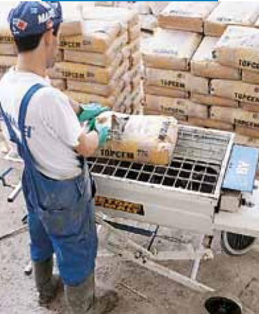
Realizarea amestecului Topcem cu malaxor orizontal având ax spiralat

Topcem este iritant și conține ciment care în contact cu transpirația sau alte fluide ale