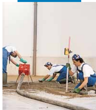
Aplicarea și nivelarea mortarului de Topcem