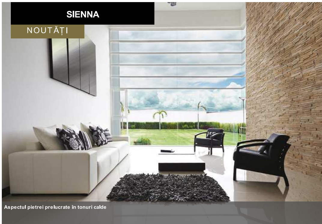
Aspectul pietrei prelucrate în tonuri calde