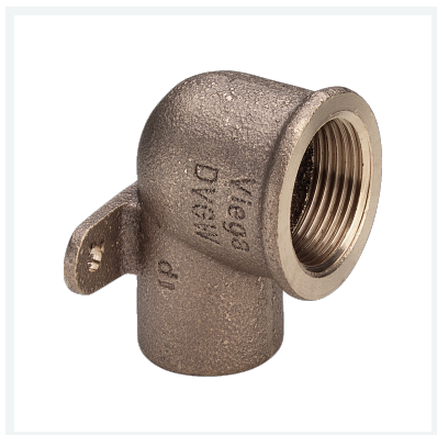
Cot cu talpă model 94472G articol 100 223