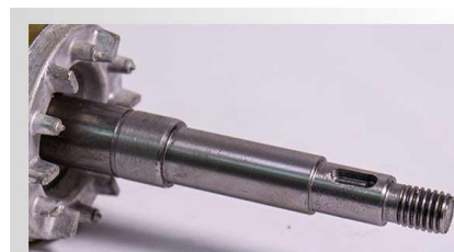
Ax pompa din inox